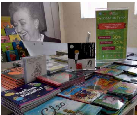
Mesa De fondo en Fondo en la librería Elsa Cecilia Frost en Tlalpan.