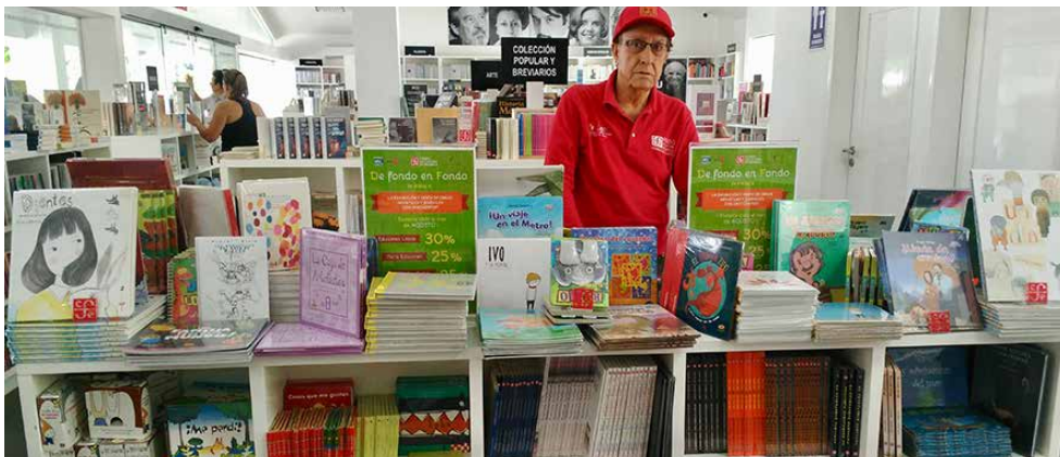
Mesa De fondo en Fondo en la librería José Carlos Becerra en Tabasco.

El objetivo de esta iniciativa es apoyar el crecimiento de los resultados de la promoción, en cuanto a ventas y desplazamiento de ejemplares, a través de los librereros, como mediadores y prescriptores con el público, y la mejor forma de