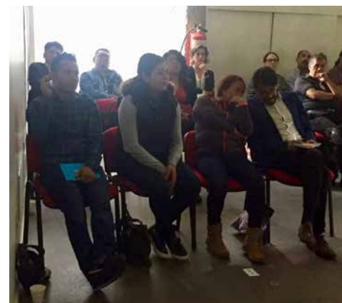
Asistentes al Curso de capacitación para la campaña De fondo en Fondo.